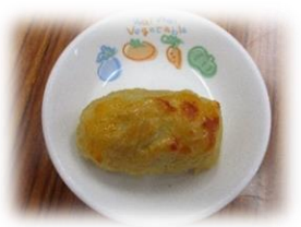
手作りスイートポテト